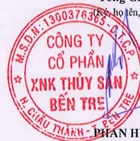
PHAN HỮU TÀI

CÔNG TY CỔ PHẦN XUẤT NHẬP KHẨU THỦY SẢN BẾN TRE Thành: CÔNG TY CỔ PHẦN XUẤT NHẬP KHẨU THỦY SẢN BẾN TRE. DID: 0.9.2342.19200300.100.1.1+MST: 1300376365 Reason: I am approving this document Location: your signing location here Date: 2025.01.23 18:30:01+0700 Foxit Reader Version: 10.1.0